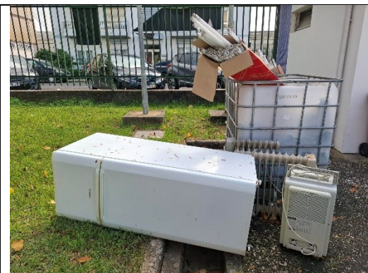
Fig.1) Gestão de REEE, observa-se a deposição inadequada