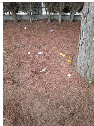
Fig 3) Impacto ambiental local