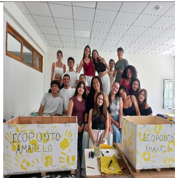
Fig 6) Economia Circular/Cidadania