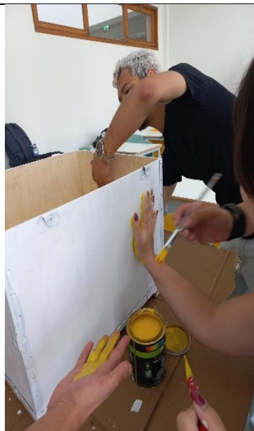
Fig 5) Participação Ativa dos alunos