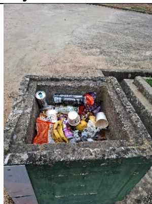
Fig.2) Desperdício e mistura de resíduos